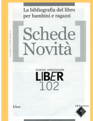
La bibliografia del libro per bambini e ragazzi - Inserto di LiBeR