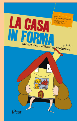
La casa in forma